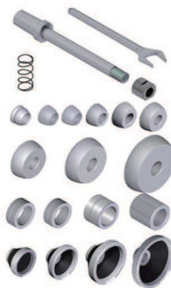
TDL30 乗用車&ライトトラックアダプターセット